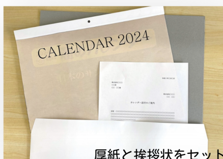
厚紙と挨拶状をセット